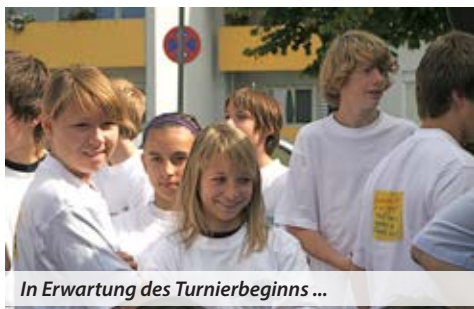
In Erwartung des Turnierbeginns ...

Hervorgegangen aus einer Initiative der damaligen kommunalen Jugendpflege Neuhofen im Jahr 1995, hat sich das Brunnenfest auf dem Partnerschaftsplatz im Lauf der Jahre als Fest der Partnerschaft zwischen der französischen Gemeinde Heillecourt und Neuhofen etabliert und ist damit beim ursprünglichen Festgedanken angekommen.