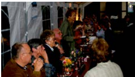
... bis Sonntag in die Abendstunden ...