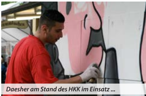
Daesher am Stand des HKK im Einsatz ...