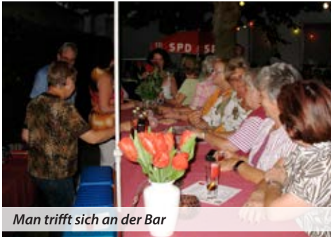
Man trifft sich an der Bar