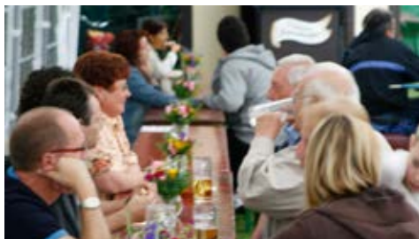
Ein volles Zelt von Samstag nachmittag ...

Wir freuen uns in jedem Fall auf die Fortführung beider Feste in einem gemeinsamen Kontext - und werden Aktiv unseren Beitrag zu deren Gelingen leisten