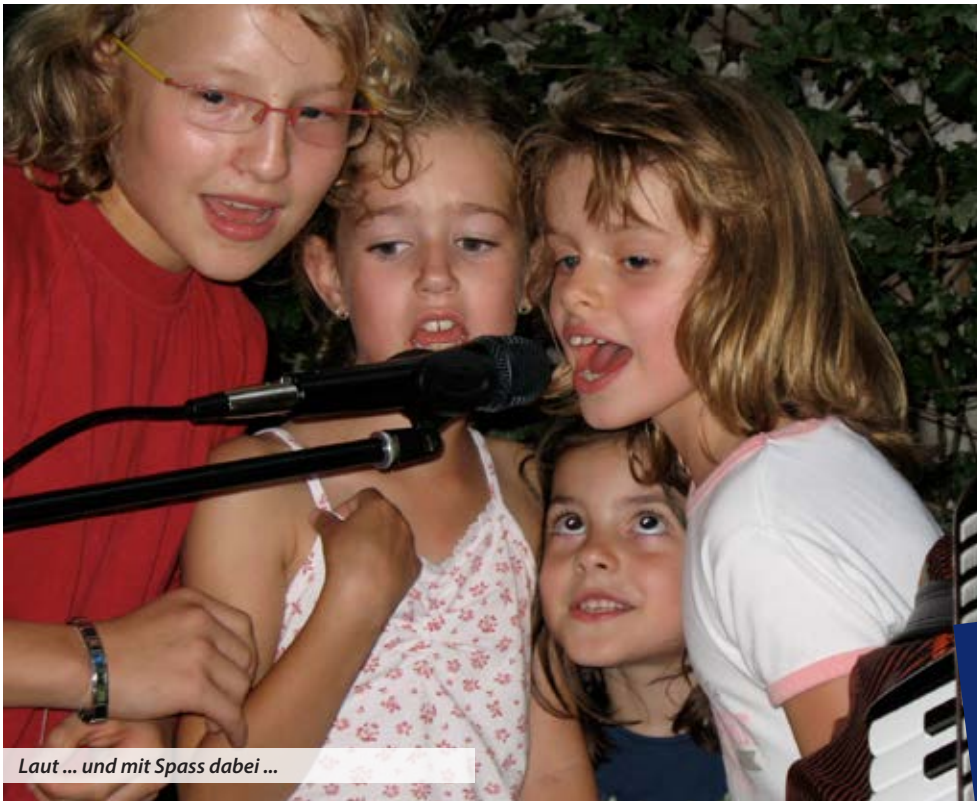
Laut ... und mit Spass dabei ...