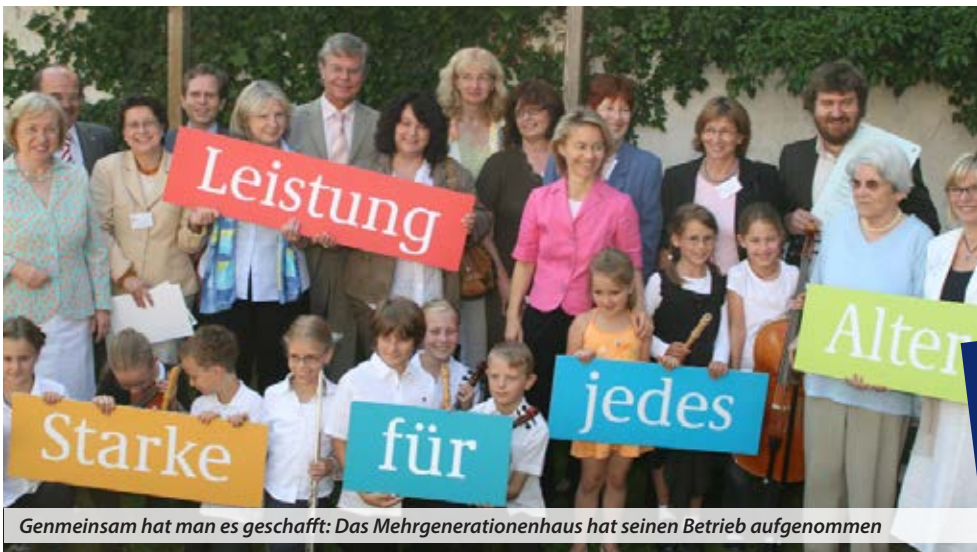
Gen gemeinsam hat man es geschafft: Das Mehrgenerationenhaus hat seinen Betrieb aufgenommen

Jetzt schon vormerken Weihnachtskonzert mit den Mainzer Hofgängern am Donnerstag, den 18.12.2008 um 19.00 Uhr im Bürgerhaus „Neuer Hof“.