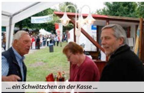
... ein Schwätzchen an der Kasse ...