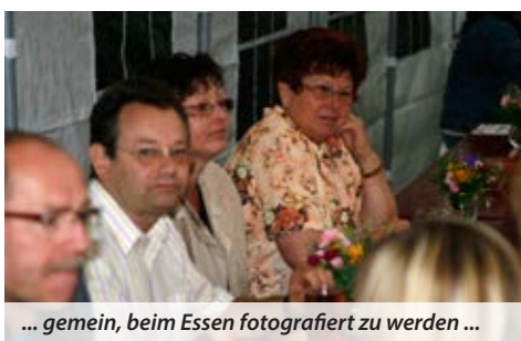
... gemein, beim Essen fotografiert zu werden ...