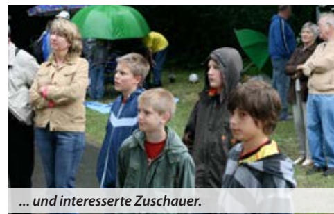
... und interesserte Zuschauer.