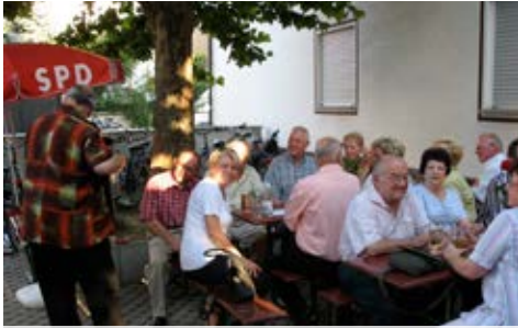
Prominenz: MdB Doris Barnett mit Partner