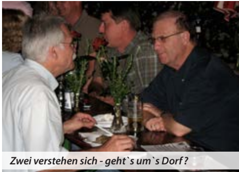
Zwei verstehen sich - geht's um's Dorf?