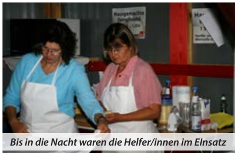
Bis in die Nacht waren die Helfer/innen im Einsatz