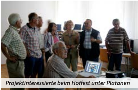
Projektinteressierte beim Hoffest unter Platanen