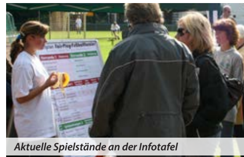
Aktuelle Spielstände an der Infotafel

Insbesondere die aktive Beteiligung der Spieler/innen an den Nachbesprechungen und die Akzeptanz der Entscheidungen der Teamer trugen dazu bei, dass das gesamte Turnier ausgesprochen harmonisch verlief